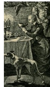
eine Szene aus der Serie Game of Thrones im Vergleich zu einer Illustration der 32. Novelle Marguerite de Navarres aus dem 16. Jahrhundert