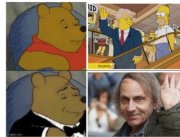
die Simpsons im Vergleich zu Houellebecq